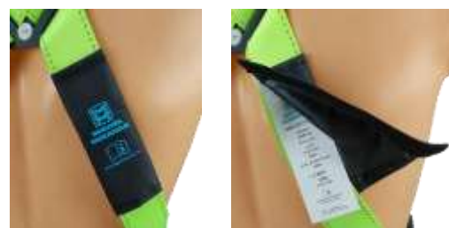
Etiqueta protegida con funda de nylon con velcro.