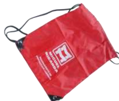
Se suministra con bolsa porta equipos tipo mochila