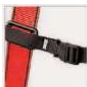
Hebilla de conexión y regulación