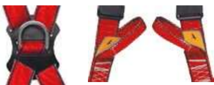
Punto anclaje dorsal