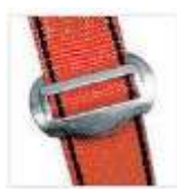
Hebilla de conexión y regulación