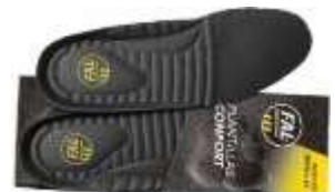
Plantillas extraíbles. Lavables