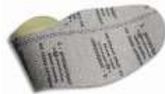
Plantilla anti-perforación flexible